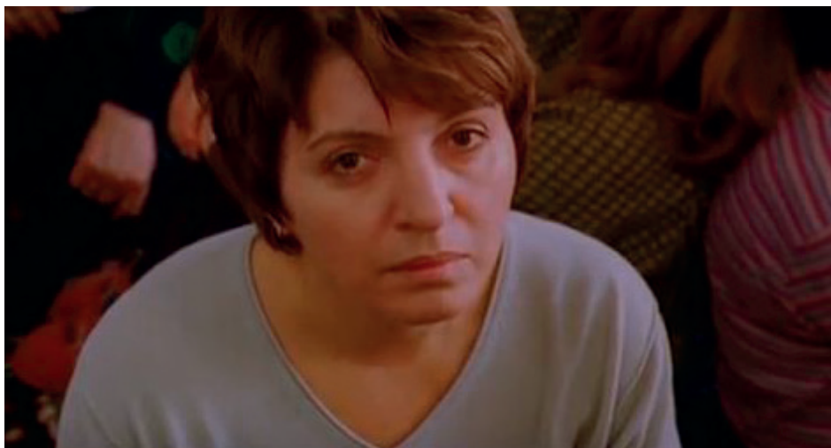
Figura 3. Immagine dal film Grbavica (Il segreto di Esma)

corpo, un corpo violato come quello di Esma, e un corpo che deve attraversare una rinascita, come quello di Sara, anche per lei nella sequenza finale, la canzone tradizionale bosniaca rappresenterà quel percorso di reinserimento nel tessuto sociale.