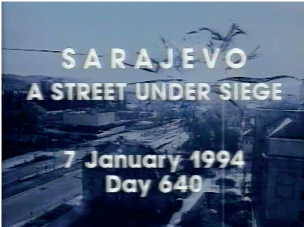
Figura 1. Immagine dal film A Street under Siege

anche alcuni attori britannici che però non poterono raggiungere la Bosnia in guerra. Pochi anni più tardi Obala Art Center e Miroslav Purivatra cominciarono l'avventura del Sarajevo Film Festival (241).