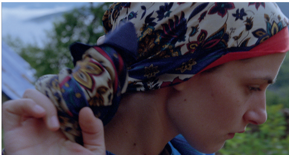
Figura 5. Immagine dal film Snijeg (Snow)