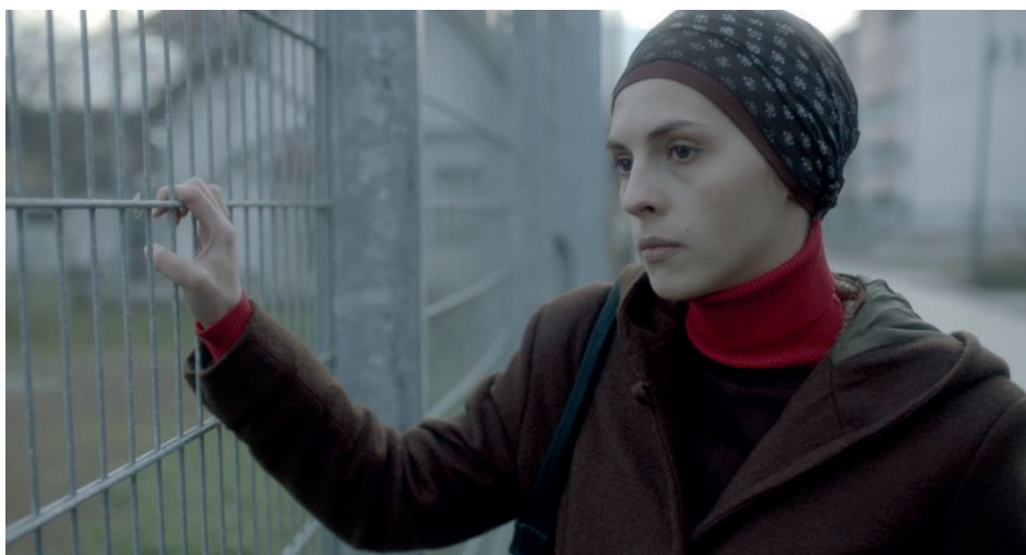
Figura 6. Immagine dal film Djeca (Children of Sarajevo)

sue varie forme (colorato, sciolto al vento, da indossare, da annodare, da bloccare sotto il mento ecc.), scandisce i momenti del film e il percorso di Alma nella riaffermazione di un proprio ruolo all'interno della piccola società del villaggio e nella costruzione di una nuova vita oltre il conflitto. L'hjib è uno degli elementi connotativi e simbolici anche del personaggio di Rahima in Djeca , qui il velo è il segno di demarcazione tra gruppi sociali, tra emarginati e socialmente accettati.