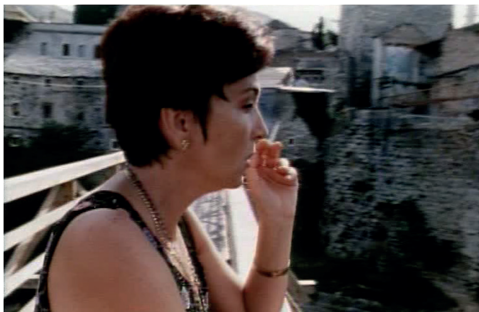
Figura 2. Immagine dal film Red rubber boots

In questi primi lavori documentaristici e poi successivamente nella dimensione del cinema di finzione, Jasmila affronta il tema del trauma bellico. Nei suoi film è possibile riconoscere ciò che Shoshana Felman e Dori Laub (1992, 57-8) descrivono nel libro Testimony . Il percorso di elaborazione del trauma comincia innanzitutto con la testimonianza, un processo che non può avvenire senza entrambi i soggetti coinvolti: non solo il testimone, ma anche l'ascoltatore, in questo caso l'artista e attraverso di lei lo spettatore. L'ascoltatore diventa partecipante e comproprietario dell'evento traumatico, perché la sua presenza determina la nascita di una nuova fase di conoscenza e consapevolezza dell'evento. Adottando tale ruolo, l'ascoltatore accetta di condividere in parte l'esperienza del trauma su di sé. Dori Laub osserva, dalla propria esperienza personale, come il processo di testimonianza sia analogo alla pratica psicoanalitica, un 'breve contratto terapeutico', una sorta di accordo tra due persone: il testimone accetta di narrare il proprio trauma ricostruendo i fatti della propria vita, l'ascoltatore, che sia intervistatore o terapeuta, assume il compito di accompagnare il testimone in questo percorso (70).