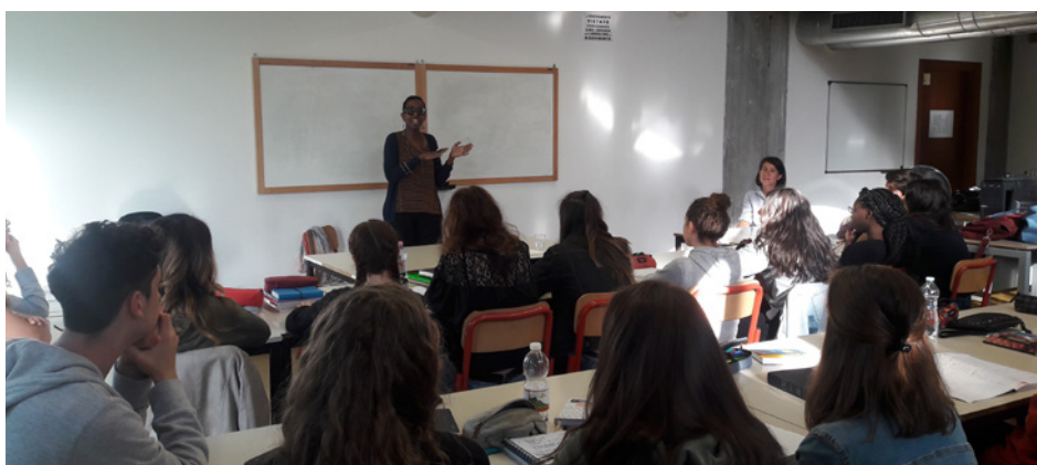
Igiaba Scego all'Istituto professionale C. Musatti, Dolo