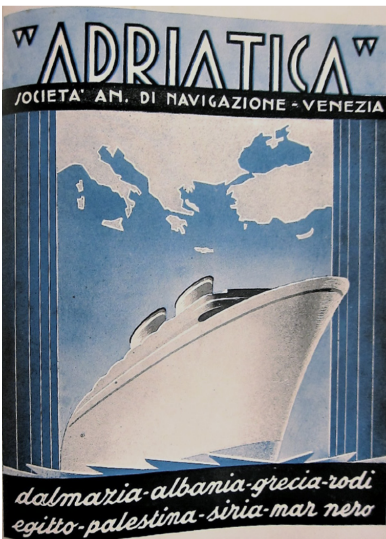
Figura 3 Pubblicità della Società Adriatica di navigazione, 1937-38. Guida commerciale della città e della provincia di Venezia. Venezia: Soc. Editr. Mutilati e Combattenti