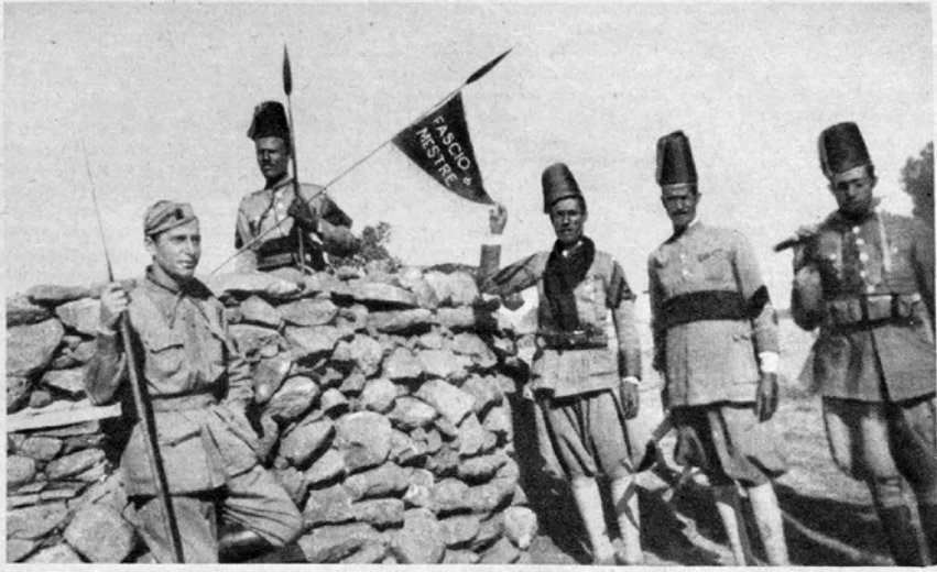
Figura 2 Gagliardetto offerto dal Fascio di Mestre al 51.mo Battaglione Eritreo, Ficé (Scioa), 28 febbraio 1937. Venezia, Il Gazzettino Illustrato

A. O. I. - Il Gagliardetto offerto dal Fascio di Mestre (Venezia) al 51.mo Battaglione Eritreo dell' XI Brigata Indigena (Colonna Gerelli) sventola a Ficé (Scioa). A destra: Il Cap. Baso riceve alcuni preti copti venuti a Ficé per far atto di sottomissione