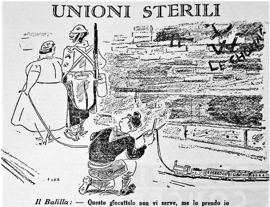
Figura 5 «Unioni Sterili». «Pagina coloniale», 9, 22 gennaio 1939. Venezia, Gazzetta di Venezia