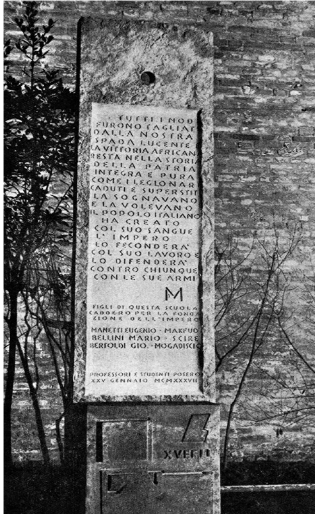
Figura 10 Stele ai cafoscarini caduti «per la fondazione dell'Impero», 1937. Venezia, Università Ca' Foscari. Annuario 1936-37