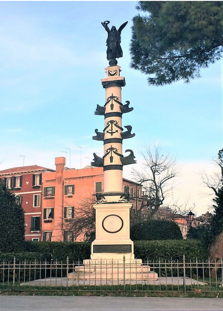
Figura 4 Monumento ai Marinai d'Italia. Colonna rostrata, 1876. Venezia, Giardini Napoleonici