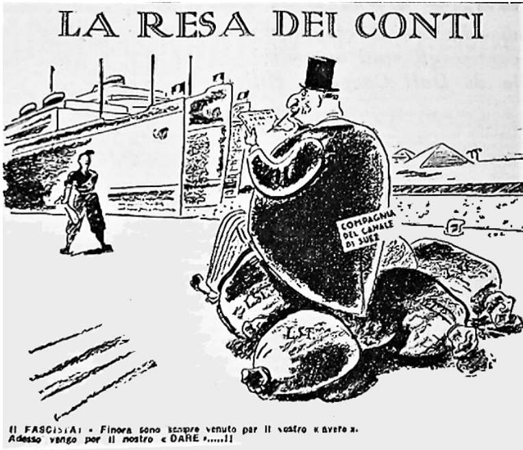
Figura 6 «La resa dei conti». «Pagina coloniale», 12, 19 marzo 1939. Venezia, Gazzetta di Venezia