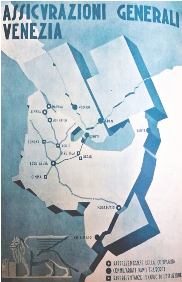
Figura 8 L'inserzione pubblicitaria delle Assicurazioni Generali Venezia, 1936. Venezia. OND, ICF (a cura di), Giornata coloniale della Sezione veneziana dell'Istituto coloniale fascista