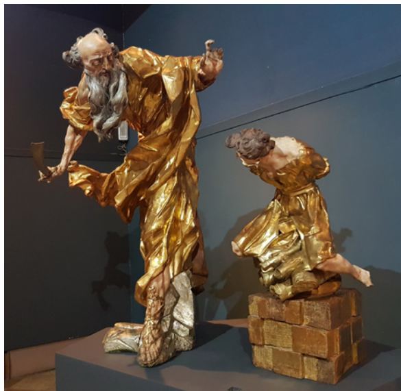
Figura 1 I.G. Pinzel, Abramo e Isacco . Il metà XVIII del secolo. Legno dipinto e dorato. L'viv, Museo di scultura barocca di I.G.Pinzel