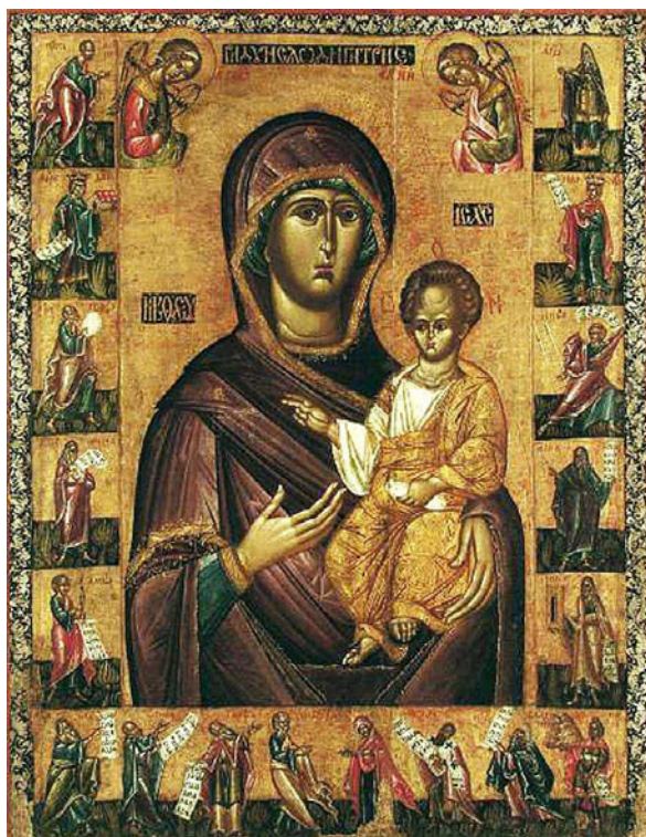
Figura 2 Madonna da Pidhorodci . Fine del XV-inizio del XVI secolo. Tempera su tela. L'viv, Museo dell'Arte Ucraina