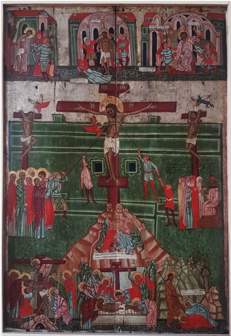
Figura 3 Le Passioni da Trushevychi . Regione di L'viv. Fine del XV-inizio del XVI secolo. Tempera su tavola. L'viv, Museo dell'arte ucraina,