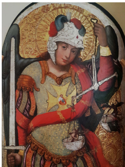
Figura 12 Ivan Rutkovych, Arcangelo Michele . Fine del XVII secolo. Tempera e olio su tavola. Parte dell'Iconostasi della chiesa della natività di Zhovkva. L'viv, Museo dell'arte ucraina