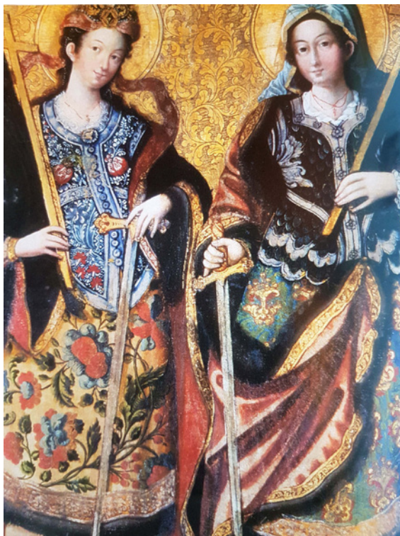
Figura 14 Le sante martiri Iuliana e Anastasia. Scuola di Kyiv. 1740 ca. Tempera e olio su tavola. Kyiv, Museo nazionale dell'arte ucraina

vo e colori intensi. Questi colori però sono variabili, cambiano tonalità nei limiti dello stesso colore - un chiaro influsso dei frescanti barocchi, in particolare di Jerzy Szymonowicz che lavorava nei palazzi dei magnati ucraini e polacchi (ad esempio nel castello di Žhovkva). Non c'è pathos nelle scene e nei volti dei suoi personaggi, ma nobiltà, dignità, riservatezza [fig. 12]. L'artista inserisce in alcune opere un paesaggio quasi realistico, senza però abbandonare del tutto gli elementi dorati.