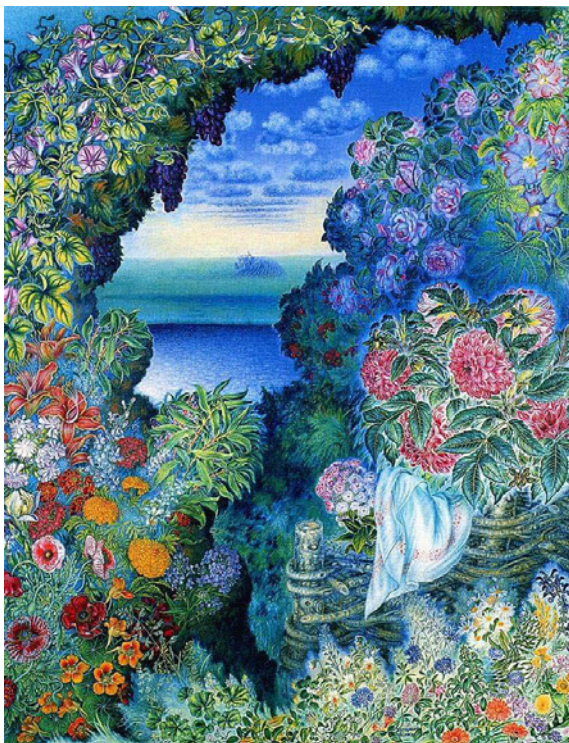
Figura 17 Kateryna Bilokur, Campo di kolkhoz , 1948-1949. Olio su tela. Kyiv, Museo dell'arte decorativa

me e i colori è diverso: nella gamma brunastro-rosso cupo, nei colori che vanno dal bianco al verde acido si percepisce quasi il dolore e l'urlo di solitudine, mentre la pittrice ucraina placa quell'urlo, trasformandolo in una visione serena e gioiosa. Emblematico è il quadro in cui un trattore, che doveva essere il simbolo di una vita nuova, ma che per un ucraino era in realtà solo l'immagine della collettivizzazione e della violenza del regime sovietico, diventa un miraggio innocuo nell'azzurro lontano del paesaggio, incorniciato e quasi avvolto da un fiume di fiori [fig. 17]. Bilokur lo smorza, lo scioglie, lo circonda e lo argina. Sembra quasi una stregoneria attorno a un 'mostro' legato all'immagine e al ricordo degli anni Trenta e dei milioni di morti di Holodomor. Kateryna aveva vissuto tutto questo, ma nei suoi quadri vediamo il contrario, una realtà immaginaria che cura quella empirica. Oksana Zabužko, scrittrice e filosofa, definisce le opere della Bilokur una sorta di «icone laiche» (2011, 17): sono, infatti, le icone di una religione arcaica e panteista, di una conversazione subconscia con la Terra, che ha tenuto in vita l'etnia ucraina.