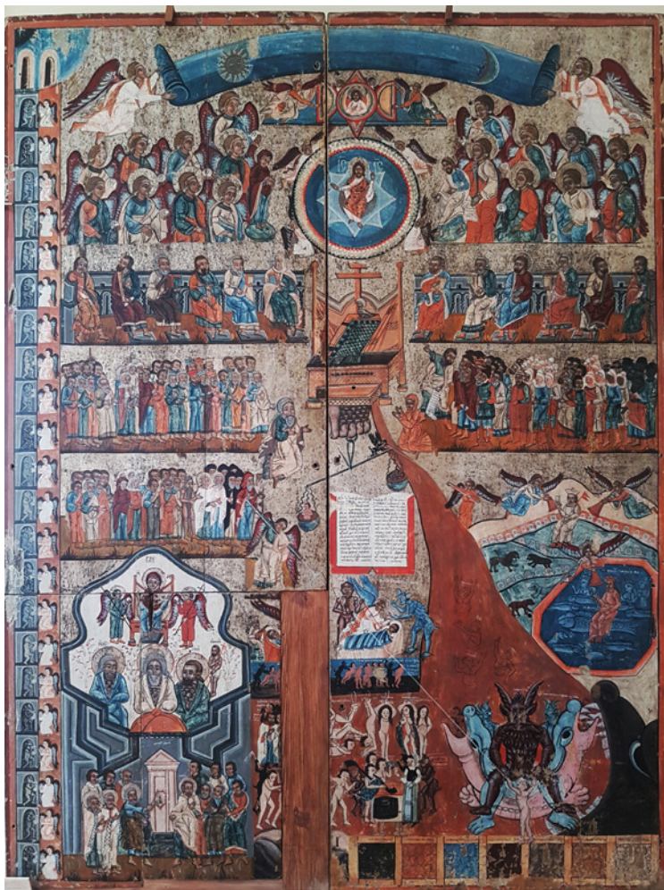
Figura 7 Il Giudizio Universale da Trushevychi . Il metà del XVI secolo. Tempera su tavola. L'viv, Museo dell'arte ucraina