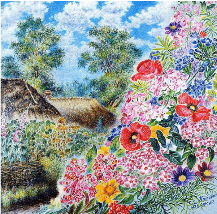
Figura 16 Kateryna Bilokur, Casa a Bohdanivka , 1955. Olio su tela. Kyiv, Museo dell'arte decorativa

ai tempi della rivoluzione, della Guerra Civile e della collettivizzazione staliniana, appassionata fin da piccola dell'arte pittorica tanto da dover sempre combinare, con enorme fatica, il suo lavoro nei campi con la pittura. Non fu ammessa alla Scuola artistica di Kharkiv perché non aveva finito i sette anni della scuola obbligatoria, nonostante fosse una lettrice appassionata e colta. Considerata dai famigliari e da molti abitanti del suo villaggio come una figura bizzarra, riuscì comunque a esprimersi ed essere accettata anche ufficialmente, senza mai abbandonare la campagna. Con i pennelli sottilissimi e i colori fatti a mano (solo dopo anni riuscì ad avere quelli professionali) e un lavoro contadino estenuante, la Bilokur riuscì comunque a trovare la solitudine e il tempo necessari da dedicare all'arte (Zabužko 2011, 11-28). Verrebbe da chiedersi dove riusciva a trovare le forze per creare quadri con fiori e natura, pieni di una gioia e di una serenità quasi mistica [fig. 16]. Un esempio simile dello stesso periodo fu quello di un'altra autodidatta geniale, la francese Séraphine de Senlis, donna delle pulizie e lavandaia di giorno, artista di notte, immersa, come la Bilokur, in un mondo di fiori fantastici. Ma il suo rapporto con le for-