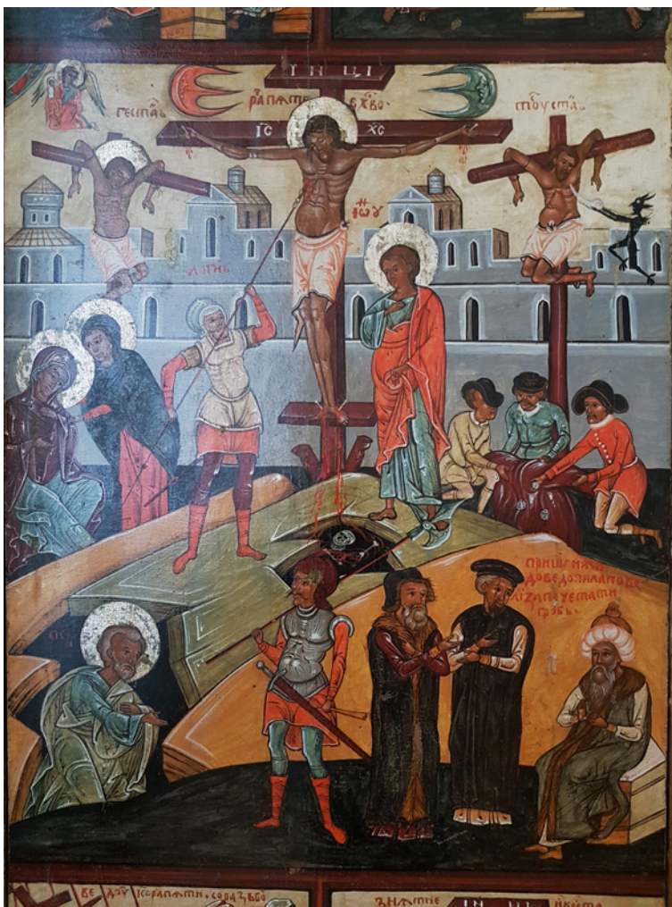
Figura 6 Le Passioni da Bahnuvate. Il metà del XVI secolo. Tempera su tavola. L'viv, Museo dell'arte ucraina