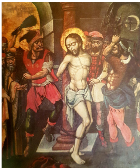
Figura 11 Mykola Petrakhnovych, Flagellazione . 1630 ca. Tempera su tavola. L'viv, iconostasi della chiesa della Dormizione