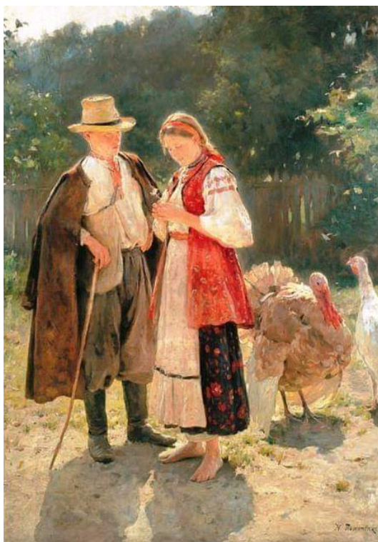
Figura 15 Mykola Pymonenko, Idyllia . 1908. Olio su tela. Kyiv, Museo nazionale dell'arte ucraina

te di Kyiv del XVIII secolo e delle altre regioni dell'Ucraina orientale: Le sante martiri Juliana ed Anastasia (1740) appaiono gioiose e colorate, con i volti vicini all'ideale di bellezza femminile ucraina e i vestiti che assomigliano a esuberanti giardini in fioritura. Lo stesso vale per gli affreschi della chiesa della Santa Trinità del Monastero delle Grotte di Kyiv (1730-40) oppure per l'iconostasi della chiesa di Soročynci (1732 circa) [fig. 14] (Žoltovs'kyi 1998, 10-57).