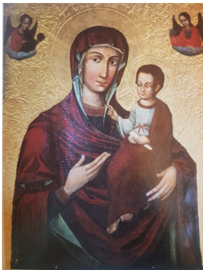
Figura 10 Fedir Sen'kovych, Madonna Odigitria . L'viv, 1630. Tempera su tavola. L'viv, Museo dell'arte ucraina