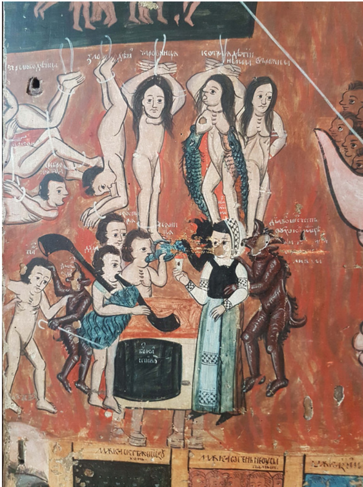
Figura 8 Il Giudizio Universale da Trushevychi. Dettaglio