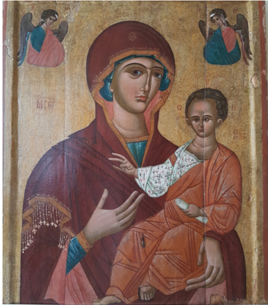
Figura 5 Madonna Odighitria da Krasiv, Regione di L'viv. XVI secolo. L'viv, Museo dell'arte ucraina

se è più che evidente il ruolo di una propria tradizione precristiana.