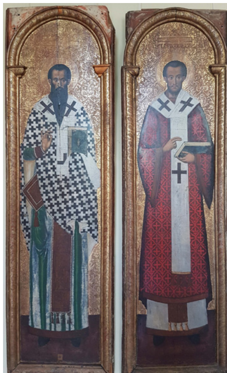
Figura 9 Fedir Sen'kovych, SS. Basilio e Giovanni Crisostomo . 1620 ca. Tempera su tavola. L'viv, Museo dell'arte ucraina

gli artisti più significativi, partendo da quelli dell'Ucraina occidentale.