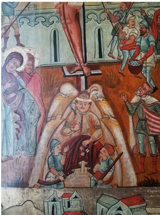
Figura 4 Le Passioni da Velyke . 1593. Tempera su tavola. L'viv, Museo dell'arte ucraina

Madonna considerata il 'palladium' di Re Danylo di Galizia) (Ovsijčuk 1996, 118-20). L'arte diventa invece una sorta di patria spirituale, un elemento che unisce e consolida la nazione. Così il «fattore umano» prevale su quello puramente ecclesiastico. Tra le immagini sacre si distingue non tanto un Cristo-Re quanto un Cristo-Uomo che scende sulla terra e si fa carne. Il tema delle Passioni diventa uno dei più frequenti nelle icone ucraine, perché così si sottolinea l'aspetto umano di Gesù [fig. 3]. 2 La sua importanza cresce nei periodi di guerre frequenti e di vessazioni politiche e religiose, quando i torturatori di Cristo assumono le sembianze dei nemici, e sono vestiti, ad esempio, come i Ljaky , i polacchi [fig. 4]. Per lo stesso motivo sono molto popolari il San Giorgio che uccide il drago e l'Arcangelo Michele, i santi guerrieri che combattono il male e difendono i 'giusti'. Ma l'immagine-chiave resta per secoli quella della Vergine, che incarna la Madre Terra, la difesa e la speranza. Possiamo affermare che l'arte religiosa ucraina abbia senz'altro ereditato le tradizioni dell'antica Kyiv, a sua volta legate alla matrice bizantina (Aleksandrovyč 1996, 130-1), anche