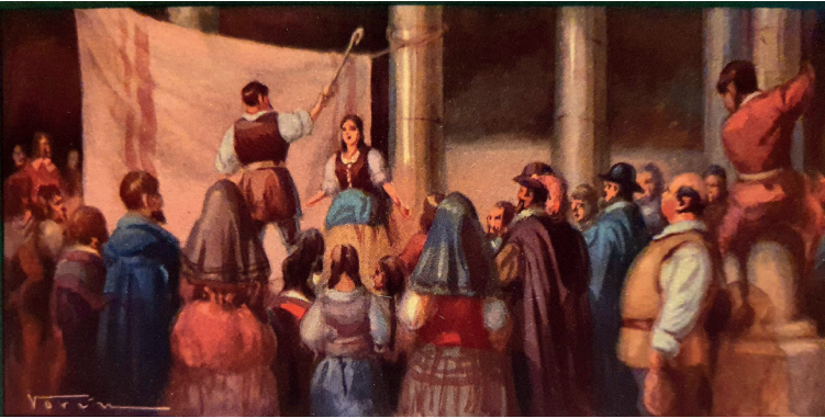
Figura 1 Autor desconocido, Representación teatral de Lope de Rueda. ca. 1940-50. 15 × 7,5 cm. Colección de Cromos Culturales. Serie de Miguel de Cervantes. Barcelona: editorial Barsal. Colección del Autor