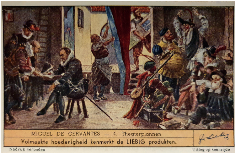
Figura 3 Autor desconocido. Cervantes y actores ensayando en un corral de comedias. 1948. 7 × 11 cm. Colección de cromos Liebig. Serie Miguel de Cervantes (en holandés). Bélgica: Compagnie Liebig. Colección del Autor