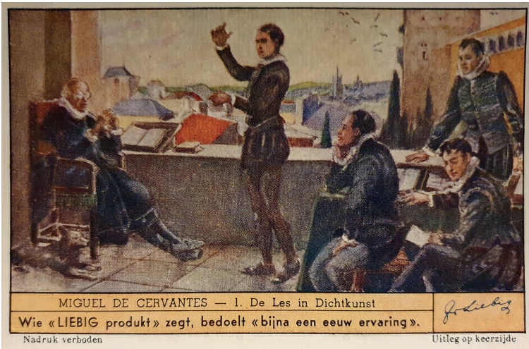
Figura 2 Autor desconocido. Miguel de Cervantes, joven, recitando ante López de Hoyos. 1948. 7 × 11 cm. Colección de cromos Liebig. Serie Miguel de Cervantes (en holandés). Bélgica: Compagnie Liebig. Colección del Autor

ta enseñanza se derivara después que Cervantes ejerciera como su «repetidor», es decir, como ayudante del catedrático en el Estudio.