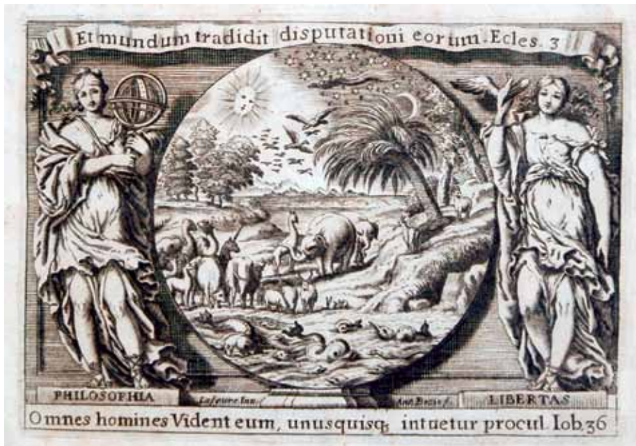
Fig. 5. Vignetta per frontespizio incisa a bulino da Antonio Bosio su invenzione e disegno di Valentin Lefèvre. Particolare