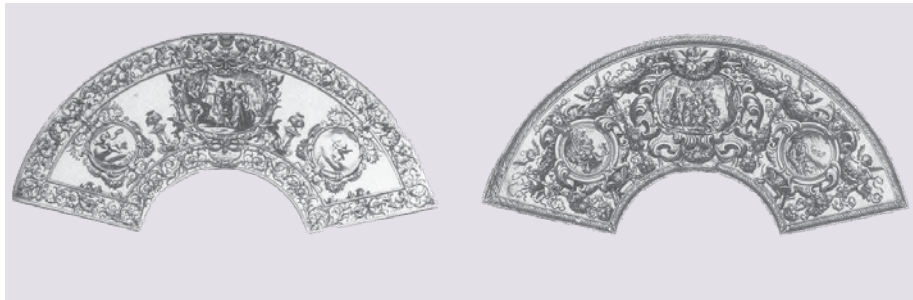
Figg. 12a-c. Esempi di ventole: a banderuola di pergamena traforata con manico in avorio e accanto di paglia intrecciata; ventola a rosta (con manico centrale in avorio) incisa su carta; in basso ventagli incisi da Abrham Bosse