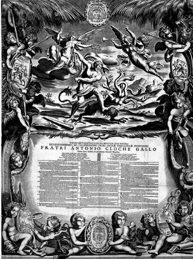
Fig. 11. Esempio di tesi dottorale o conclusion , pubblicazione d'occasione incisa e impressa su carta – gli esemplari più preziosi su pergamena o anche su seta. In bottega erano disponibili i fogli illustrati più o meno sontuosamente, mentre il testo veniva stampato nello spazio lasciato in bianco, una volta che il candidato avesse scelto l'incisione di suo gusto (e alla sua portata)