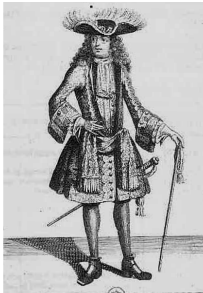
Figg. 10a-d. Modine francesi incise a bulino, da incorniciare per ornare le pareti domestiche