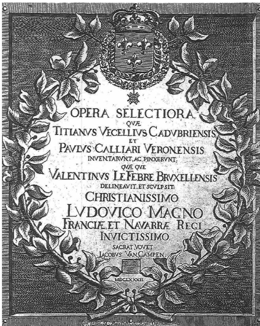
Fig. 13. Antiporta della raccolta di circa 50 incisioni da dipinti di Tiziano e di Paolo Veronese realizzate dall'artista fiammingo Fiorentino o Valentin Lefèvre († Venezia 1677), edite nel 1682 da Jacob van Campen.

Molte delle incisioni del corpus erano in vendita presso la bottega Bosio