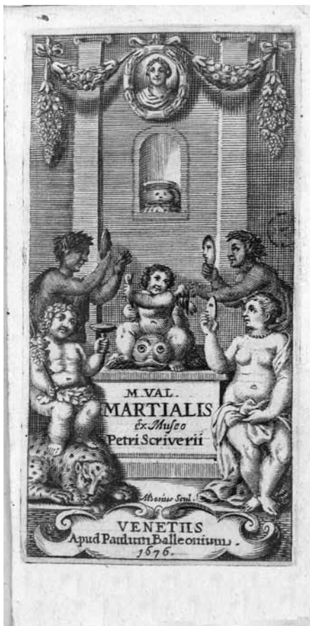
Figg. 6, 7. Antiporte incise a bulino da Antonio Bosio per classici editi da Paolo Baglioni in 24°