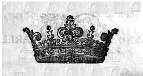
Figg. 3a-d. Fregi xilografici frequentemente adoperati nelle edizioni Bosio