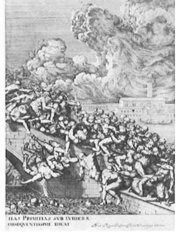
Fig. 15. Esemplare de La battaglia dei pugni incisa da Domenico Rossetti in vendita nella bottega Bosio (B2893)