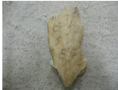
Figure 1-2 Stele di Loukou, monumento dei Maratonomachi, Museo Archeologico di Astros, nr. inv. 535