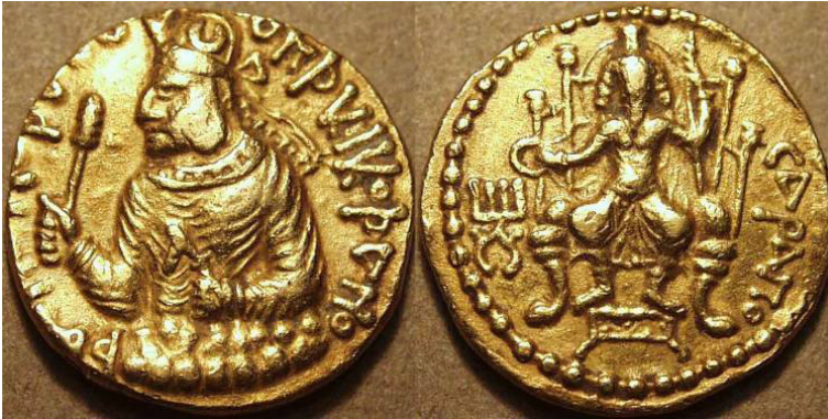
Figura 1 Moneta del re kuṣāna Huvishka che rappresenta sul rovescio Sarapis, nella legenda battriana ΣΑΡΑΠΙΟ cf. http://www.columbia.edu/itc/mealac/pritchett/00/routesdata/0100_0199/huvishkacoins/huvishkacoins.html

stituite dall'iscrizione in questione 72 e dalla legenda in lingua battriana ΣΑΡΑΠΙΟ presente sulle monete kuṣāna del sovrano Huvishka, risalenti al II secolo d.C., che rappresentano la divinità Sarapis stan- te con scettro o seduta sul trono (cf. Göbl 1984, nr. 185, 69).