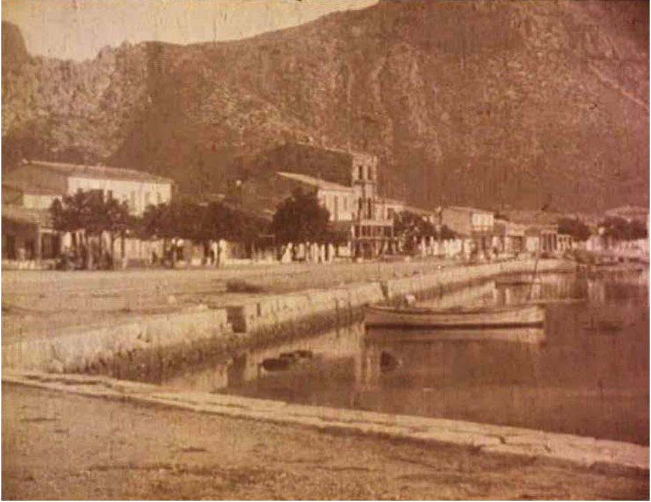
Figura 2. Immagine del Porto di Pollença nel film El secreto de la Pedriza (1926)

interesse 6 e in cui segnala che a Maiorca, pur a fronte dei molti impegni sostenuti per la promozione turistica, continuava ad esserci una sostanziale mancanza di interesse verso il cinema finalizzato alla promozione del turismo ed evidenzia anche l'impossibilità di una produzione cinematografica basata solo su capitale privato.