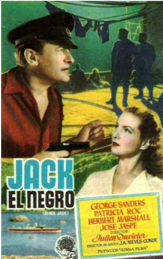
Figura 3. Immagine pubblicitaria del film Jack el Negro (1951)

dizioni antiche sono ancora presenti ma appaiono ora anche spettacoli di balli popolari maiorchini come attrazione turistica, ballerine di flamenco, e corridas . Nel documentario si fa riferimento, in particolare, alla zona della Spiaggia di Palma, luogo divenuto ormai meta di turismo internazionale, dove si trovano cartelli in tante lingue e dove - recita il documentario - «se non fosse per la spiaggia ci sembrerebbe di non sapere dove ci troviamo». Vediamo immagini di turisti biondi, un papà che gioca con i figli nella sabbia o ragazze che prendono il sole.