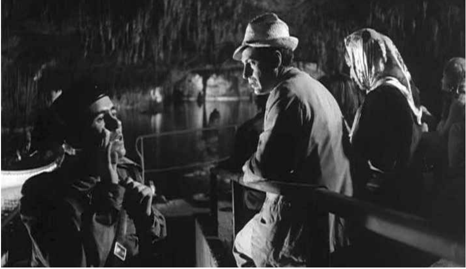
Figura 5. El verdugo (1963). Scena delle Grotte del Drach.

primo successo spagnolo nelle classifiche internazionali, 18 composto e interpretato dal gruppo formato a Maiorca, Los Bravos .