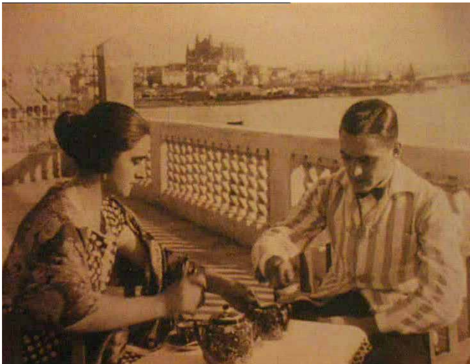
Figura 1. Flor de Espino (1925) allo sfondo vediamo la baia di Palma, con la Cattedrale

di monumenti di Palma, del Porto, ecc. (fig. 1) La nostra idea è che queste immagini siano state girate soltanto per la volontà del regista, un dentista cinefilo amatoriale, di lasciare traccia del suo amore per l'isola. Più noto è El secreto de la pedriza (Francisco Aguiló, 1926), una tragedia d'amore che ha come sfondo le vicende legate al contrabbando e che sembra abbia contribuito, anche in questo caso, al richiamo turistico per la rappresentazione di una serie di luoghi e vedute aree del paesaggio maiorchino (Font 2006, pp. 18-19) (fig. 2).