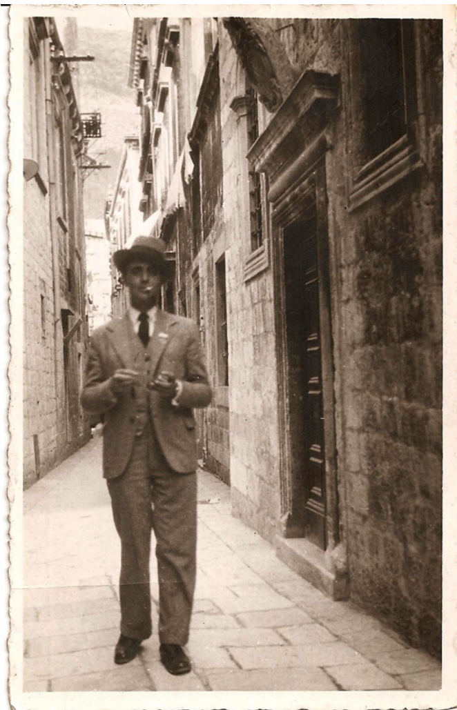
Figura 1 Foix a Dubrovnik, 1933.