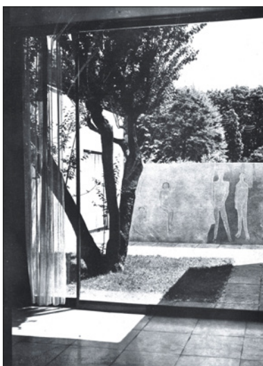
Figure 6 V Triennale di Milano 1933: patio di ingresso nella Villa-studio per un artista di L. Figini e G. Pollini. A.C. nr. 28, Biblioteca Nazionale di Spagna