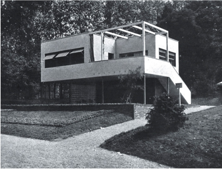
Figura 4 V Triennale di Milano 1933: Padiglione per il weekend costruito da P. Bottoni, Falludi e E. Griffini. A.C. nr. 27, Biblioteca Nazionale di Spagna

Nella V Triennale, la maggior parte dell'esposizione fu destinata infatti a «mostra della abitazione moderna»; si trattava di un gruppo di case basse isolate costruite nel centro del parco Sempione in cui si diede grande importanza al rapporto tra spazio interno e spazio esterno. Fra le altre case vi era un Padiglione per il weekend [fig. 4], la Casa per un aviatore (curiosamente con l'aereo parcheggiato nel garage della casa, come se fosse un'automobile) e un Rifugio per sciatori , temi, come si vede, veramente 'avanzati' che non avrebbero potuto incontrare in modo migliore i gusti di Foix.