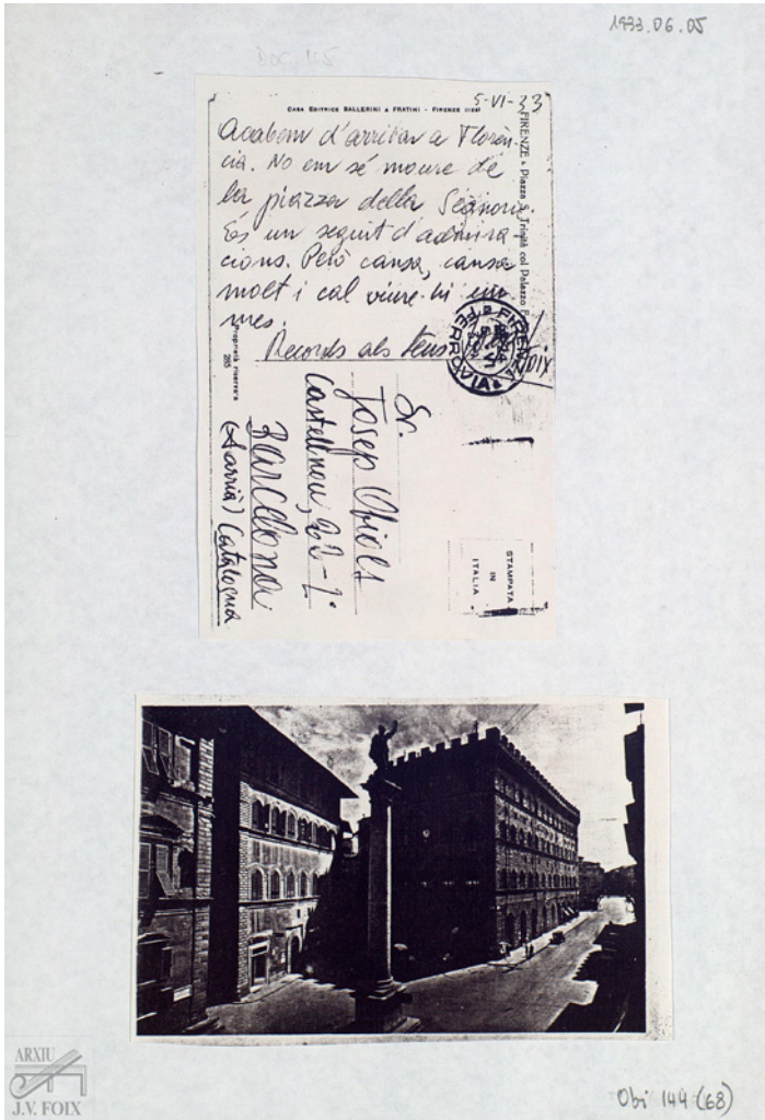
Figura 2 Cartolina di Firenze spedita da Foix a Obiols. Fundació J.V. Foix, Barcellona