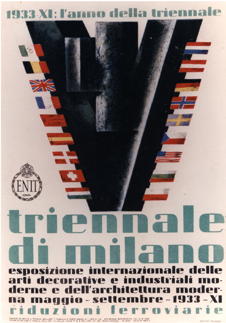
Figura 3 Manifesto della V Triennale di Milano del 1933 di Mario Sironi.