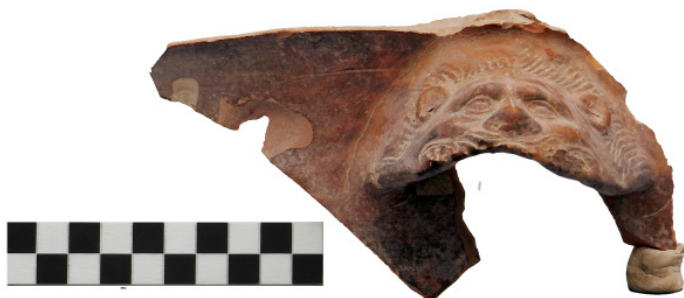
Figura 16 Museo Archeologico Nazionale di Taranto, esemplare X: elemento di braciere con nr. inv. 10601