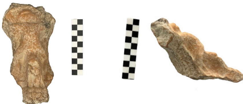
Figure 14-15 Museo Archeologico Nazionale di Taranto, esemplare IX (fronte e profilo): elemento di bracciere con nr. inv. 27618