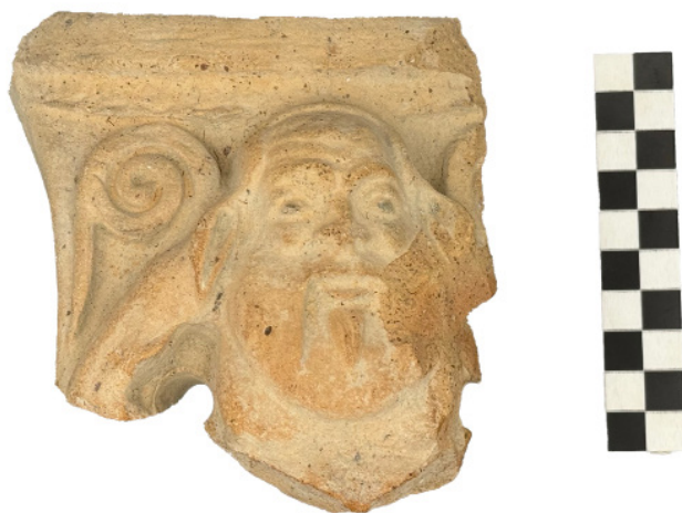
Figura 17 Museo Archeologico Nazionale di Taranto, esemplare XI: 'cooking stand' con nr. inv. 27607

A causa della loro frammentarietà, non ne è stata riconosciuta subito la funzione originaria, ma il rinvenimento a Locri di numerosi pezzi, tra cui alcuni quasi integri, ha permesso a M. Barra Bagnasco di identificarli: si trattava di sostegni ( cooking stands ) che, presumibilmente in numero di tre e separati gli uni dagli altri, servivano a sorreggere pentole durante la cottura, se si pensa a un uso quotidiano, o incensieri, se si pensa a un uso rituale. 87