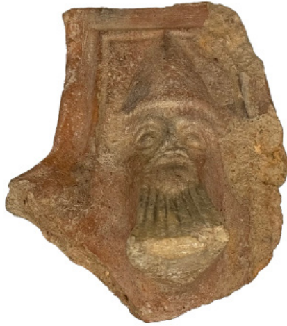
Figura 11 Museo Archeologico Nazionale di Taranto, esemplare VI: presa-sostegno di braciere con nr. inv. 29562