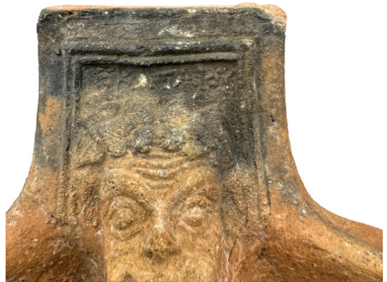
Figure 2-3 Museo Archeologico Nazionale di Taranto, esemplare I e dettaglio iscrizione: presa-sostegno di braciere iscritta con nr. inv. 122311