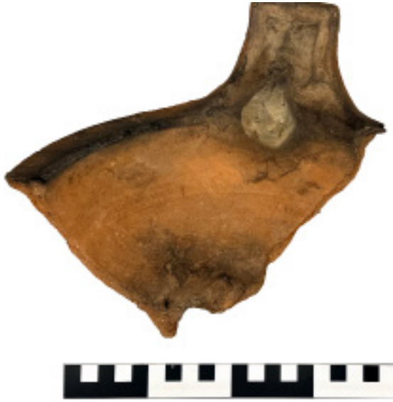
Figura 13 Museo Archeologico Nazionale di Taranto, esemplare VIII: presa-sostegno di braciere con nr. inv. 29563