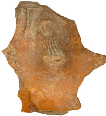
Figura 12 Museo Archeologico Nazionale di Taranto, esemplare VII: presa-sostegno di braciere con nr. inv. 199006