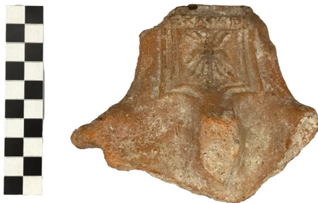
Figura 6 Museo Archeologico Nazionale di Taranto, esemplare III: presa-sostegno di braciere iscritta con nr. inv. 199013