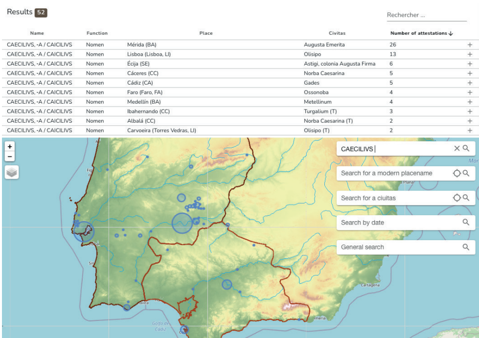
Figure 3 Interface de recherche onomastique dans ADOPIA

selon les critères souhaités. Dans le cas des listes anthroponymiques, le nom complet de la personne portant l'anthroponyme analysé est accessible avec la fonction du nom dans la dénomination personnelle. Ces anthroponymes sont accompagnés, outre de leur situation géographique, par leur fonction, leur datation, le type de document épigraphique où ils ont été attestés et la bibliographie.