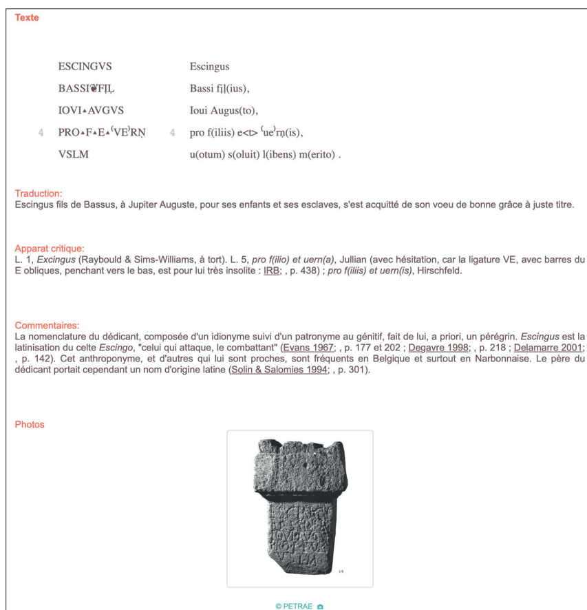
Figure 2 Exemple de visualisation d'une fiche épigraphique dans PETRAE 3.0

La dernière version de la base de données, PETRAE 3.0, créée en 2012 [fig. 2] est actuellement disponible en ligne. 13 Afin de faciliter, d'une part, la consultation des corpora et, d'autre part, l'échange de données et l'exigence de leur pérennité, PETRAE 3.0 utilise des normes et standards internationaux et participe à l'effort de normalisation de l'encodage recommandé par le consortium Text Encoding Initiative (TEI). Elle suit les directives EpiDoc (Epigraphic Documents in TEI XML). Les langages informatiques utilisés pour l'interface sont xQuery et XPath. La base de données est hébergée sur les serveurs mutualisés de la TGIR HumaNum. Un webSIG est intégré à PETRAE afin d'accéder aux inscriptions à partir d'une carte dynamique et interactive.