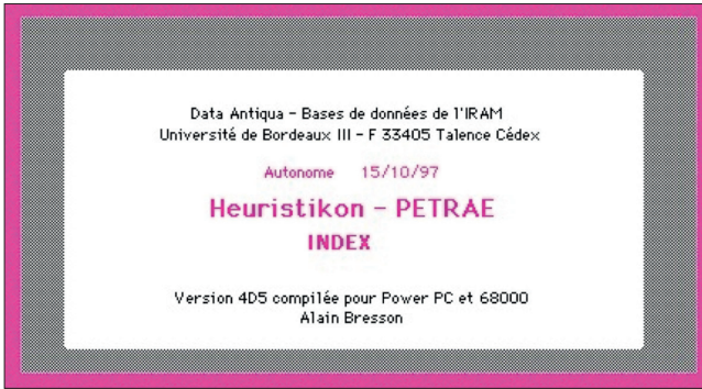
Figure 1 Écran de bienvenue de la version 4D de PETRAE (1997)

informatique des inscriptions latines et grecques, pour lesquelles des polices de caractères ont été créées. La base de données a également permis la création semi-automatique d'indices philologiques et historiques, ainsi que de concordances. 10