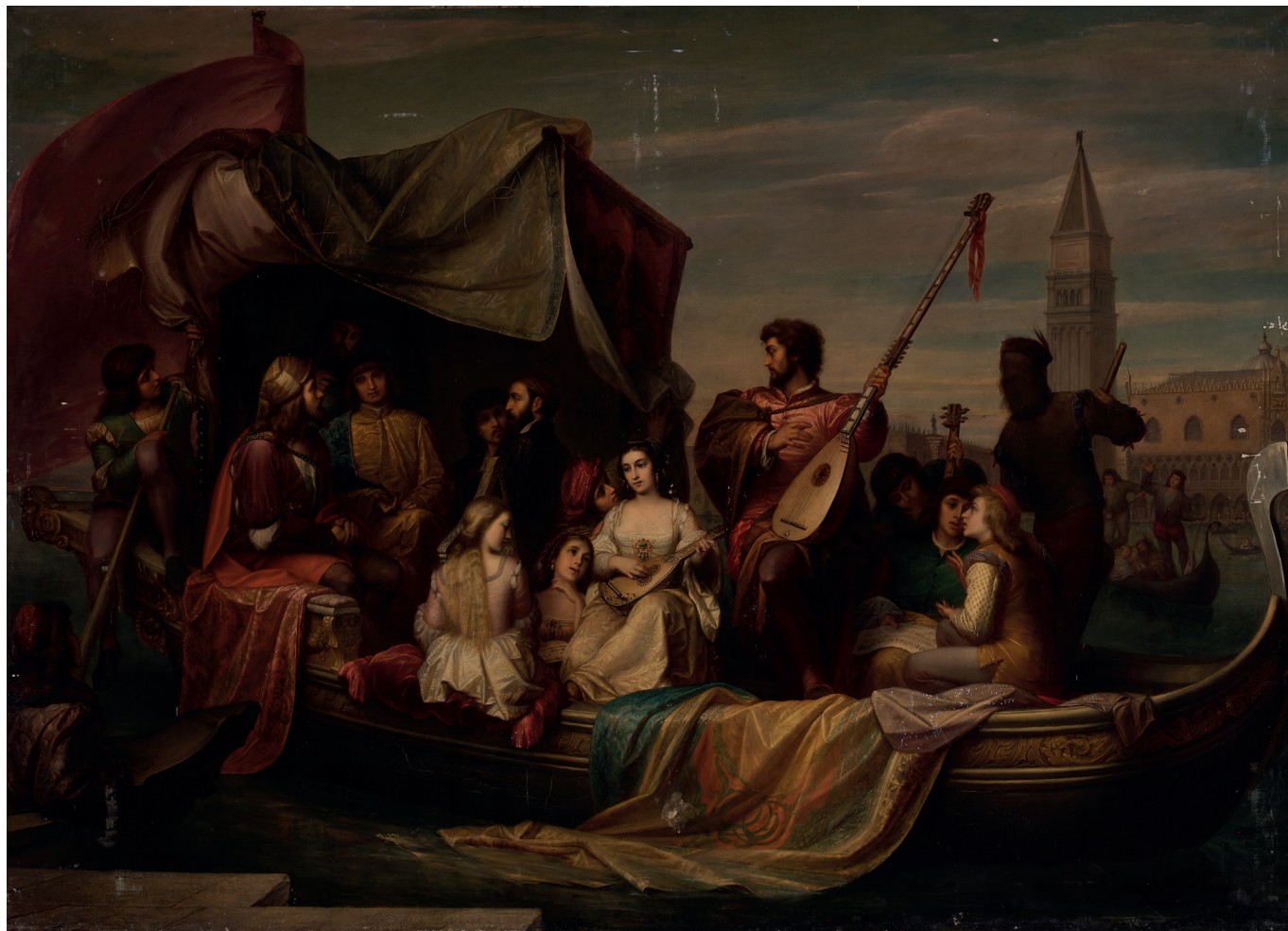
Figura 7 Jacopo d'Andrea, Giovanni Bellini e Alberto Durero festeggiati dagli artisti veneziani . 1855. Olio su tela, 170 × 233 cm. Vienna: Österreichische Galerie Belvedere

discorso di Cicognara si chiude con un'esortazione ai giovani accademici veneziani a non seguire l'esempio di Giorgione, che sacrificò l'arte sull'altare del piacere carnale.