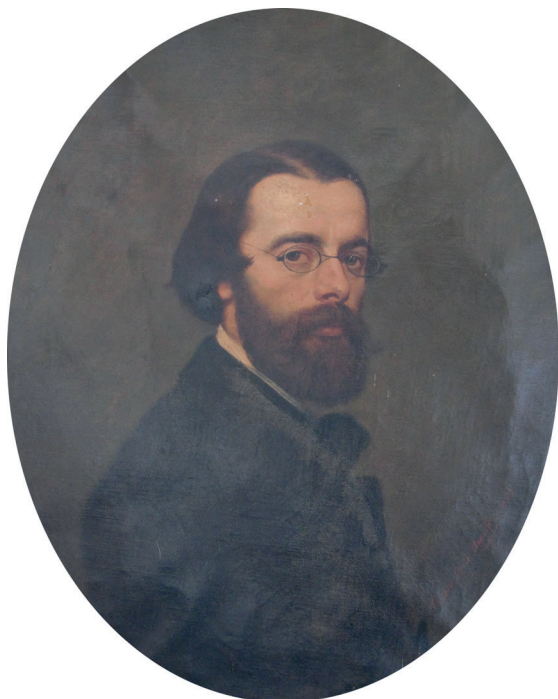
Figura 2 Cesare dell'Acqua, Autoritratto . 1856. Olio su tela, 48 × 60 cm. Trieste, collezione privata.

ge di abiti, particolarmente affidabile per quanto concerne l'abbigliamento dei veneziani dell'epoca dell'autore e del secolo precedente. La giovane del quadro di dell'Acqua si avvicina alla descrizione e all'immagine della sposa veneziana nel periodo della festa dell'Ascensione con cui ha in comune l'abito di raso bianco, tempestato di perle e fili d'oro, e il ventaglio, la cui foggia è aggiornata dal pittore secondo il suo gusto (Vecellio 1589, 99). La presenza di un cagnolino addormentato ai piedi della donna conferma l'ipotesi che si tratti di una sposa, perché era questo un comune attributo dei ritratti matrimoniali del Rinascimento, in quanto il cane è simbolo di fedeltà coniugale. L'animale dipinto da dell'Acqua è in effetti una copia precisa di quello che dorme ai piedi della cosiddetta Venere di Tiziano agli Uffizi, dipinto che, come è noto, raffigura una sposa in procinto di vestirsi [fig. 5]; un cagnolino identico, in una posa leggermente variata, appare accanto a Eleonora Gonzaga Della Rovere nel ritratto dello stesso pittore, pendant dell'immagine del marito Francesco Maria della Rovere. 5