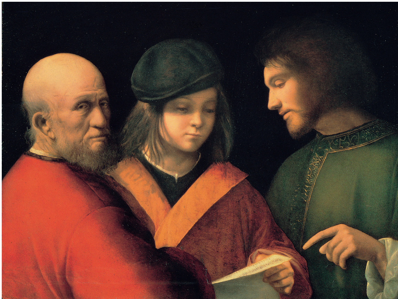
Figura 7 Giorgione, Le tre età dell'uomo . 1500-1501. Olio su tela, 62 × 77 cm. Firenze: Palazzo Pitti