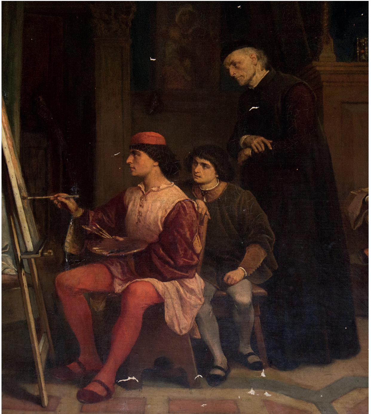
Figura 6 Cesare dell'Acqua, Giorgione stupisce Tiziano e Giovanni Bellini . 1861. Olio su tela. Dettaglio. Trieste, collezione privata.