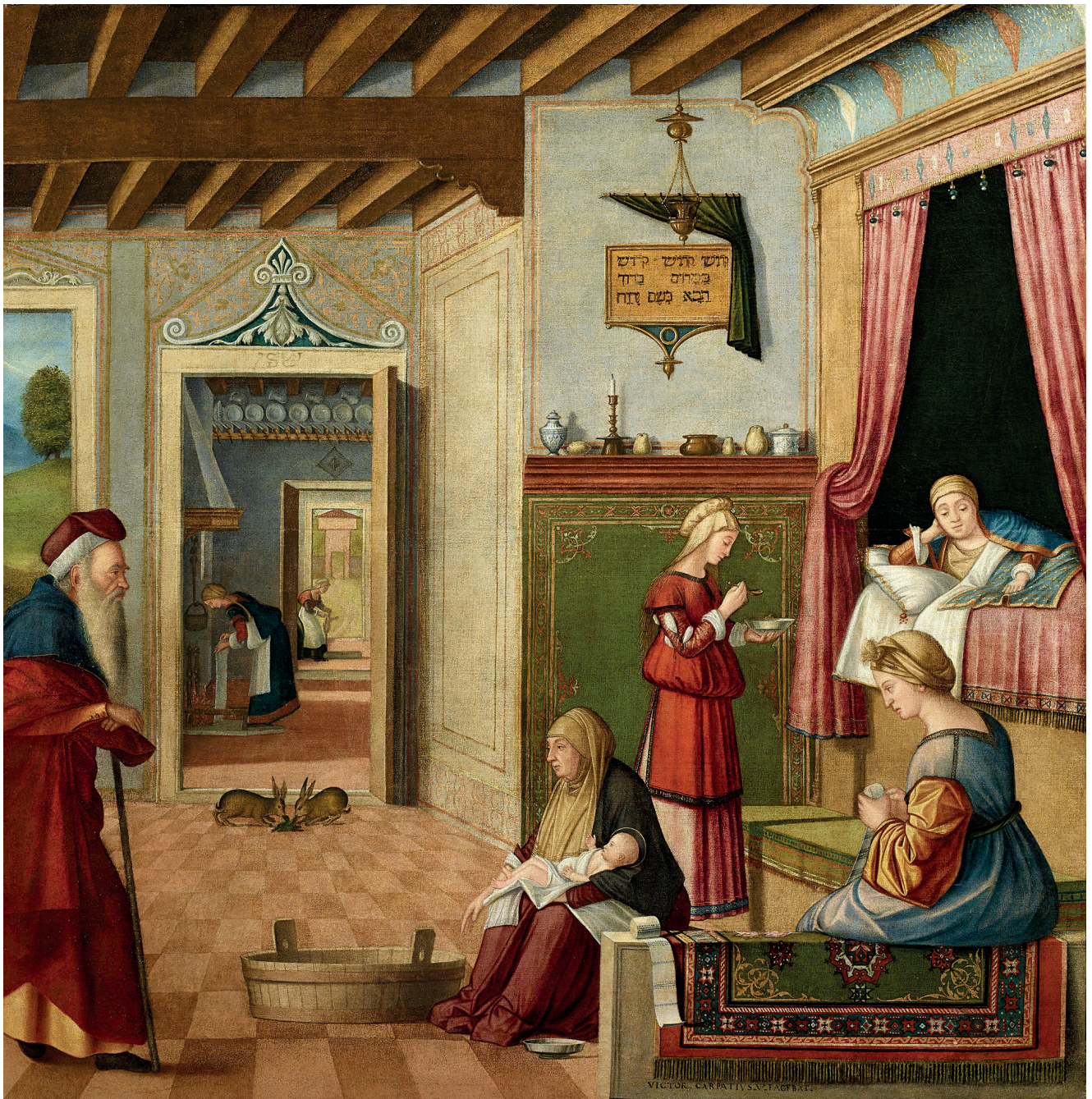
Figura 3 Vittore Carpaccio e Bottega, Nascita della Vergine . 1502-04. Olio su tela, 126,8 × 129,1 cm. Bergamo, Accademia Carrara