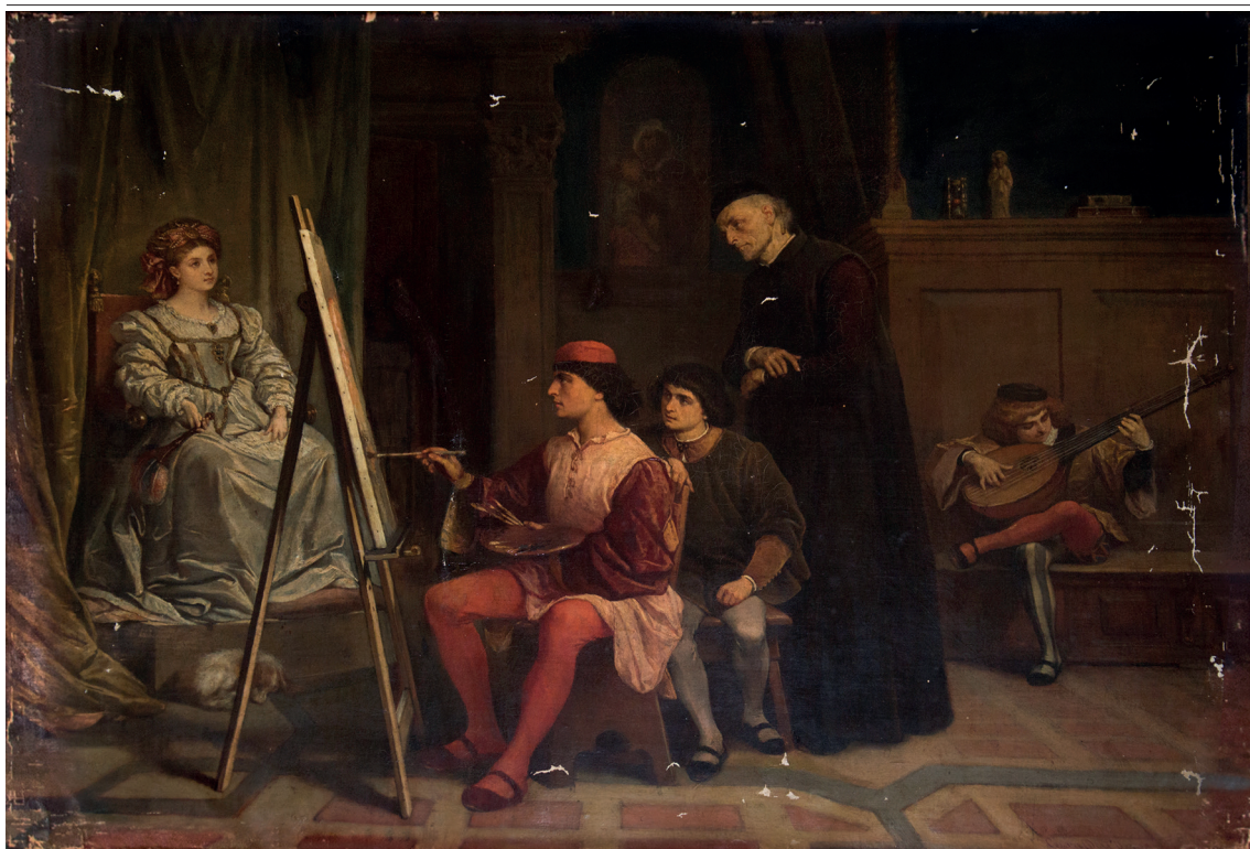
Figura 1 Cesare dell'Acqua, Giorgione stupisce Tiziano e Giovanni Bellini . 1861. Olio su tela, 64 × 80 cm. Trieste, collezione privata.

za. 2 Si tratta di una tela firmata dal pittore e datata 1861 [fig. 1]. Le condizioni di conservazione del quadro non sono ottime: si riscontrano diversi strappi nella tela e la superficie pittorica si presenta sporca e scurita dal tempo.