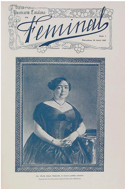
Figura 1 Coberta del primer exemplar de la revista Feminal . (Barcelona, 28 abril 1907).

Aquestes publicacions, per tant, constitueixen un altaveu fonamental per a l'emissió de les veus de dones, conservadores o progressistes, en una esfera relativament segregada però finalment pública. 6