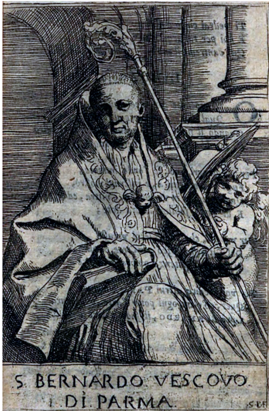
Figura 5 Sisto Badalocchio, San Bernardo vescovo di Parma in Vita di S. Bernardo Vberti 1618. Acquaforse, 160 × 95 mm. Napoli, Biblioteca Nazionale Vittorio Emanuele III

Dopo questo gli bisogna imparare ritrarre dal naturale [...] e venendogli occasione di pingere un'Istoria, gli bisogna schizzare l'invenzione al miglior modo che fa, avendo però sempre la memoria ai disegni già ritratti. (121-2)