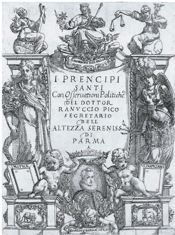
Figura 3 Gerolamo Imperiale, Frontespizio in Pico 1622. Acquaforte, 247 × 175 mm. Parma, Biblioteca Palatina-Complesso della Pilotta.