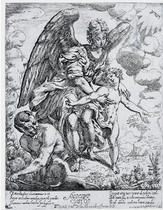
Figura 2 Gerolamo Imperiale, Angelo custode . 1622.

Acquaforte, 223 × 188 mm. Parma, Biblioteca Palatina-Complesso della Pilotta.