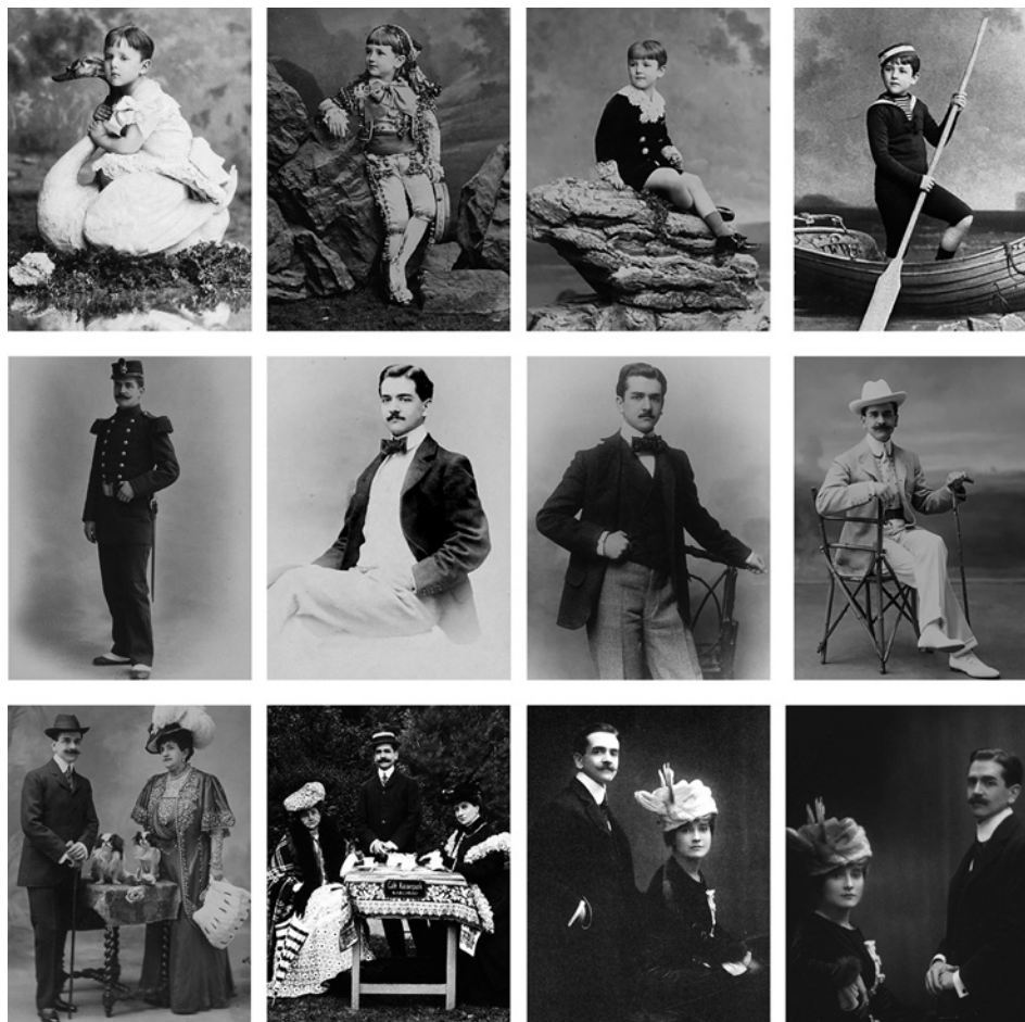
Figura 4. Doce retratos de Raymond Roussel