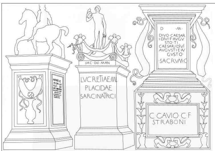
Figura 1 Restituzione a tratto del foglio 45 dell'album di disegni di Jacopo Bellini. Parigi, Musée du Louvre. Disegno dell'Autore

Per quanto riguarda la trascrizione nel foglio del Louvre dobbiamo rilevare diversi errori e fraintendimenti.