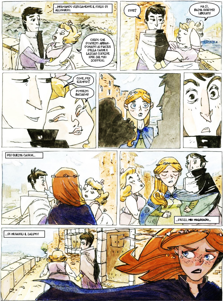
Figura 2 Rossi, D'Uva, Astrid, Dante Alighieri, 25. Beatrice incontra Dante con la 'donna schermo'

sconvolta dell'atteggiamento sensuale di Dante, 19 poi, con una ripresa visiva che trasmette un senso di passaggio temporale, ella irrompe nella scena e divide la coppia, allontanandosi, infine, in lacrime.