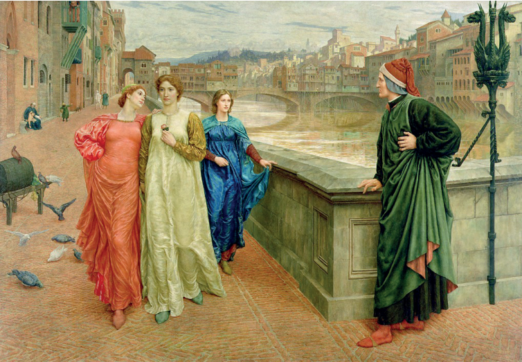
Figura 3 Rossi, D'Uva, Astrid, Dante Alighieri , 13. Dante incontra Beatrice