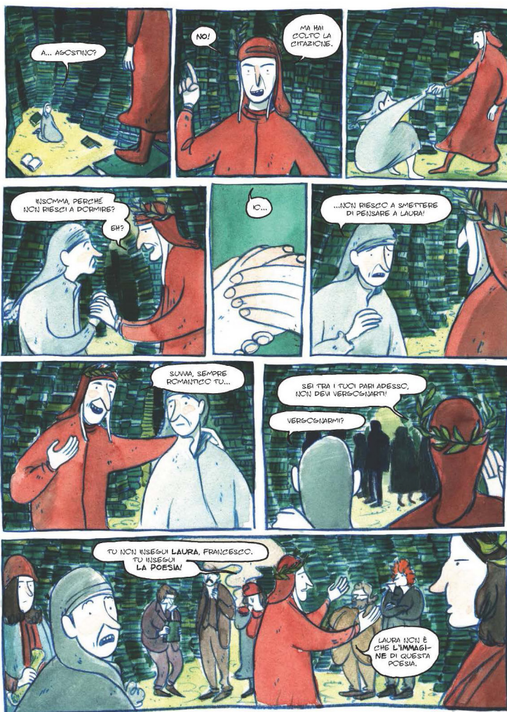
Figure 6a-b Rossi, Nuke, Francesco Petrarca, 16-17. Petrarca incontra in sogno Dante e gli altri poeti