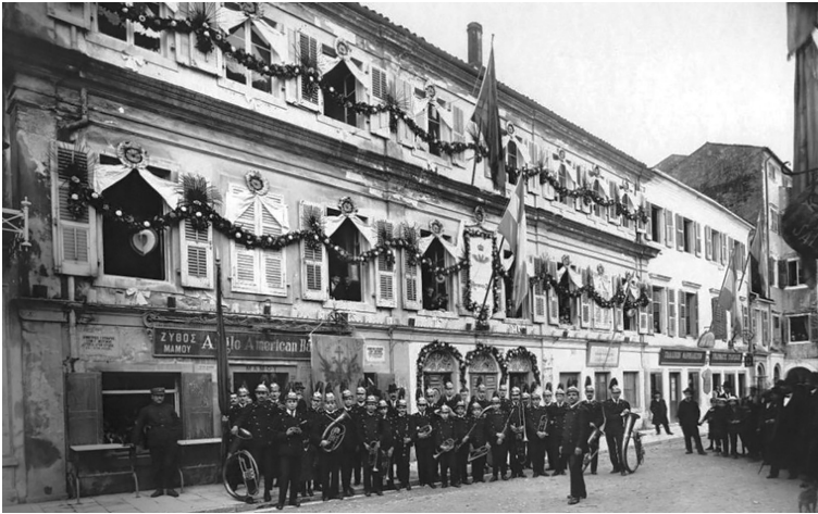
Figura 2 La banda di fiati di Corfù e il suo edificio (6 dicembre 1920), Archivio della Società Filarmonica di Corfù

Nel 1840, con alcuni altri membri del Corpo di Nobili, Mántzaros fondò la Società Filarmonica di Corfù, dove la maggior parte degli allievi e dei membri del complesso di fiati erano ragazzi provenienti dalle classi più disagiate, e alcuni completamente analfabeti (Kardamis 2006, 8). Questa istituzione musicale, prima di essere ridotta nel XX secolo a una scuola di strumenti a fiato, si configurò come la prima accademia musicale greca basata a tutti gli effetti su prototipi europei [fig. 2]. Inoltre, Mántzaros divenne un noto insegnante di contrappunto del suo tempo, continuando la tradizione contrappuntistica napoletana.