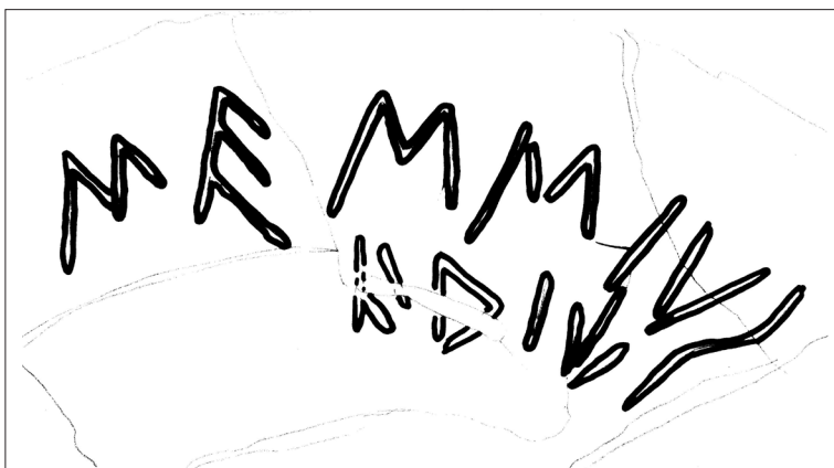
Figura 2 Disegno dell'iscrizione graffita sul frammento. Elaborazione grafica a opera dell'autore

Il luogo di rinvenimento del reperto non è precisabile all'interno della complessa stratigrafia dell'area sacra, anche se è certa la sua giacitura secondaria all'interno delle fasi IX-X del santuario, corrispondenti alla forchetta cronologica compresa tra il I secolo a.C. e il III secolo d.C. [fig. 3]. 5