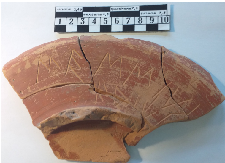
Figura 1 Frammento iscritto proveniente dal santuario in località Fornace. Altino, Museo Archeologico Nazionale.

della sua incisione e delle caratteristiche onomastiche che presenta. Esso è costituito da un lacerto di patera in terra sigillata nord italica su piede ad anello obliquo in argilla depurata arancio-rosata con superfici ricoperte di vernice rossa; composto da quattro frammenti solidali ma non ricongiunti, presenta le misure complessive, anche se ovviamente parziali, di 11 \times 18,5 \times 1,8 cm [fig. 1]. 4