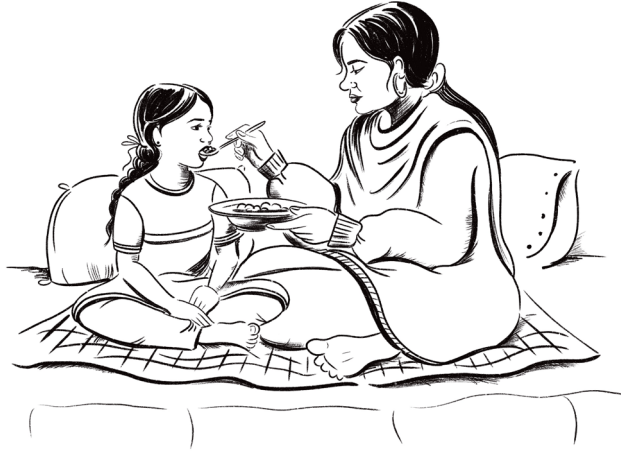
Figura 10 Il pranzo a casa di Farjana