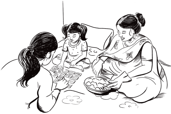
Figura 14 Giochi sul letto

L'estratto 41 si conclude con la mamma che mi chiede se posso passarle la bottiglia dell'acqua.