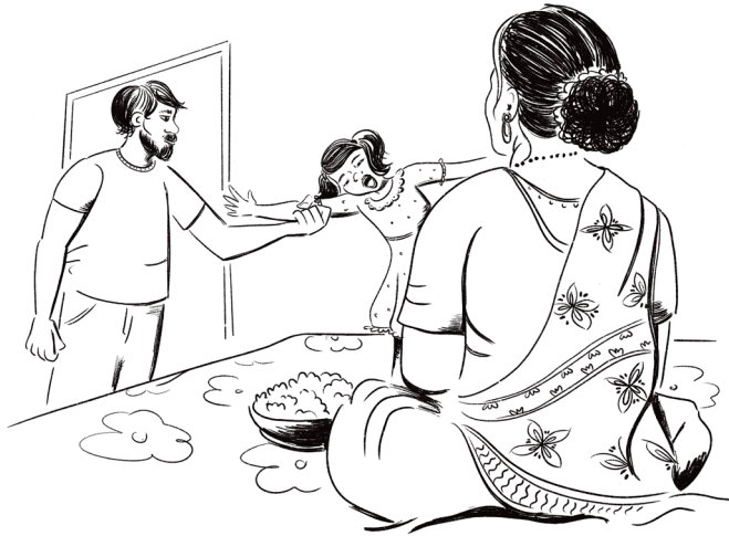
Figura 12 Jannatul non vuole mangiare

Nelle trascrizioni P è il padre mentre Ma la madre e J la bambina. Nella stanza e sul letto sono presenti libri, colori e altri giochi.