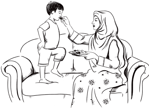
Figura 11 Il pranzo sul divano

bambino. In quell'occasione erano presenti la mamma, il bambino e altre persone che entravano e uscivano dalla stanza, prendendo talvolta parte alla conversazione. Di conseguenza, a causa dei rumori e delle voci legati alla presenza di più persone, durante il pranzo è risultato particolarmente complesso raccogliere dati audio di buona qualità. Oltre a me era presente una mediatrice linguistica, indicata nella trascrizione come Me, Mo è il bambino, mentre Ma è la mamma. In questo caso, possiamo osservare come la mamma cerchi di avviare una conversazione tra me e la mediatrice ma venga interrotta dal figlio, che, come nel caso di Farjana, esprime in maniera molto diretta un bisogno primario e una preoccupazione perché ha fame. La mamma cerca di farlo accomodare a tavola ma il bambino risponde di voler mangiare sul divano, in piedi, come mostra anche il disegno, saltando e scendendo dal divano. Mi chiedo se la mia presenza e quella della mediatrice abbiano influenzato la richiesta della mamma che ha proposto al bambino di mangiare seduto a tavola. Mohammed, infatti, rifiuta di mangiare a tavola e manifesta il desiderio di mangiare sul divano, come da abitudine. Egli stesso spiega che la sua consuetudine è mangiare sul divano.