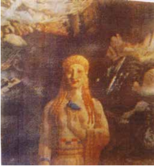
Figura 1. Léon Bakst, Terror Antiquus (part.), 1908. State Russian Museum.

Le rocce sono qua e là rossastre: somigliano molto a quelle del mio Abruzzo. Il profilo va digradando; e verso la punta estrema l'isola ha l'aspetto di un adunamento di bastioni diruti. Ecco il salto di Leucade, lo scoglio d'onde si precipitò Saffo infiammata di amore. (39)