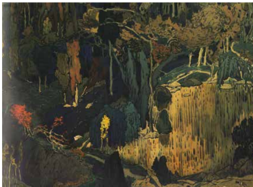
Figura 4 (a fronte). Léon Bakst, Bozzetto di scena per il balletto «L'Après-midi d'un Faune» , su musiche di Claude Debussy. Centre Georges Pompidou, Paris.