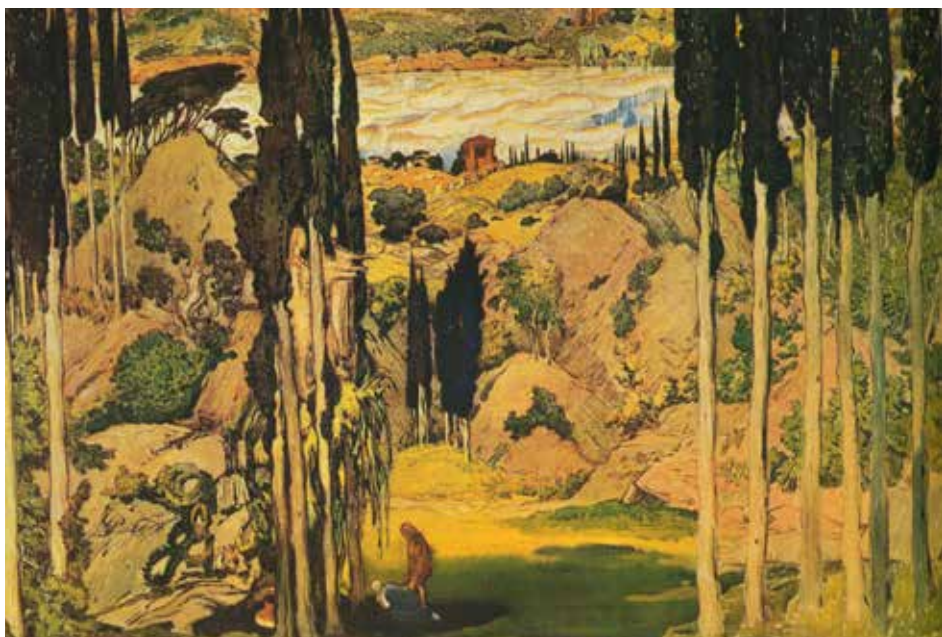
Figura 2. Léon Bakst, Bozzetto di scena per il balletto «Narcisse» , su musiche di Nikolai Tcherepnine (Paris, Théâtre du Châtelet, 1911).