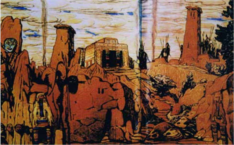
Figura 6. Léon Bakst, Bozzetto di scena per il II atto di Hélène de Sparte , tragedia di Émile Verhaeren con l'accompagnamento musicale di Déodat de Séverac (Paris, Théâtre du Châtelet, 1912). Musée des Arts Décoratifs, Paris.

Io ho ancora gli occhi dell'anima pieni dell'inaudito fulgore che i tesori del tempio d'Olimpia emanavano nelle pagine di Pausania! Leggevo pur dianzi sul ponte, la descrizione del Giove Fidiaco e della cassa di Cipselo. (43)